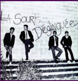
La Souris Déglinguée