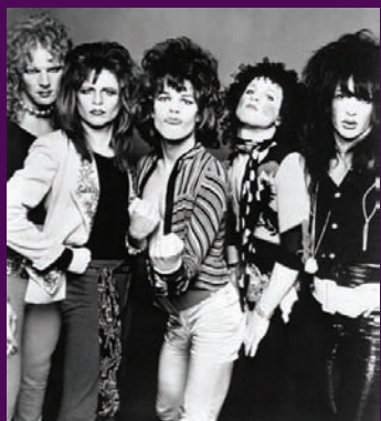
The New York Dolls