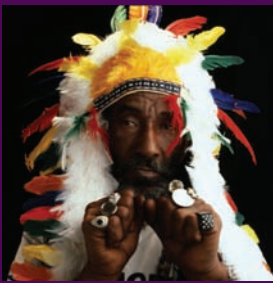
Lee Scratch Perry